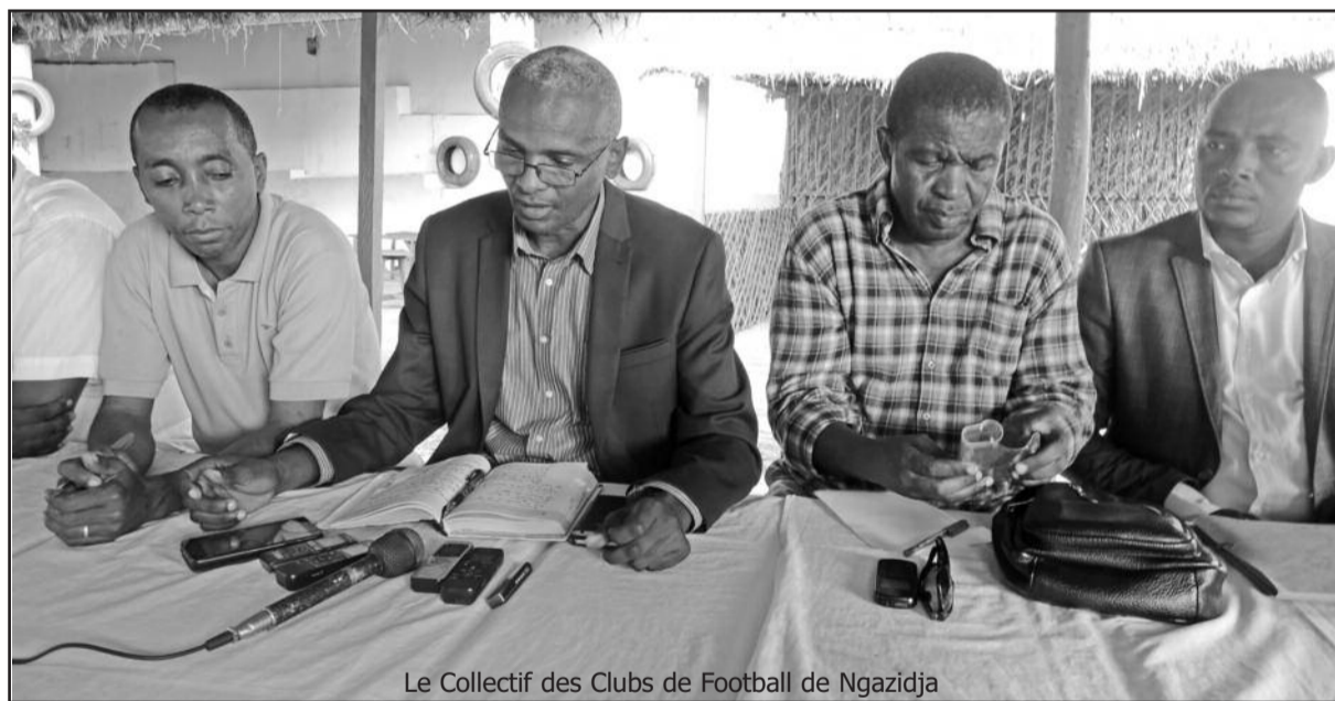
Le Collectif des Clubs de Football de Ngazidja