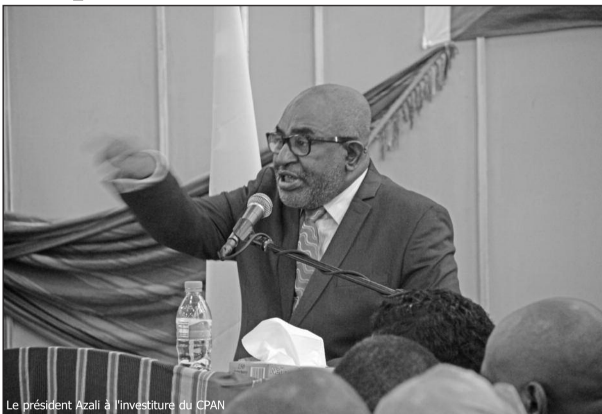
Le président Azali à l'investiture du CPAN