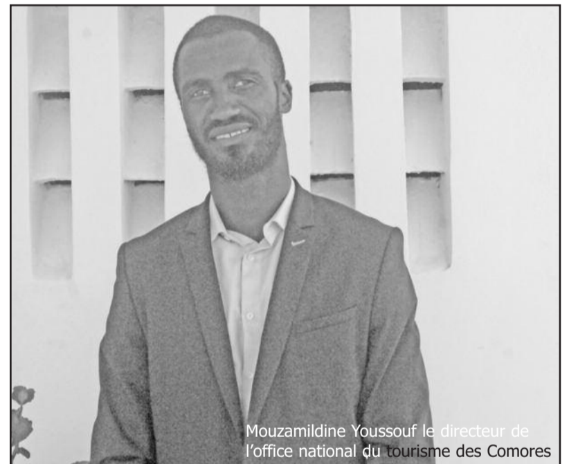
Mouzamildine Youssouf le directeur de l'office national du tourisme des Comores