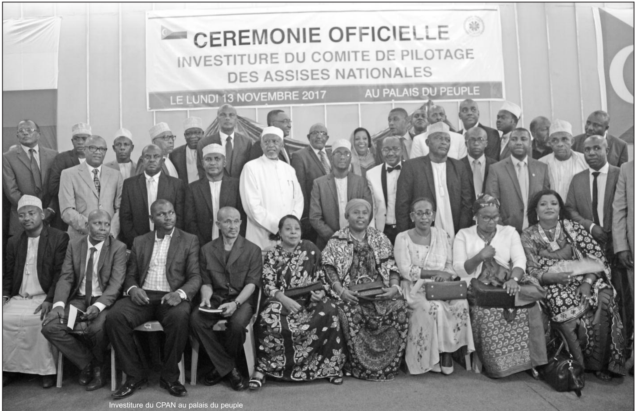
Investiture du CPAN au palais du peuple