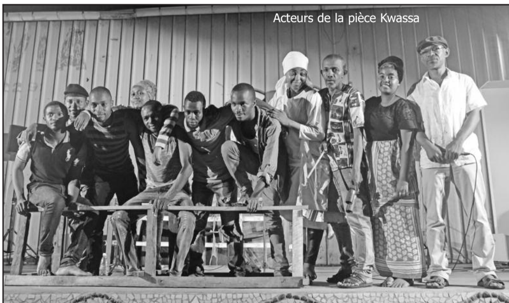
Acteurs de la pièce Kwassa

La pièce a été jouée dimanche au CCAC Mavuna.